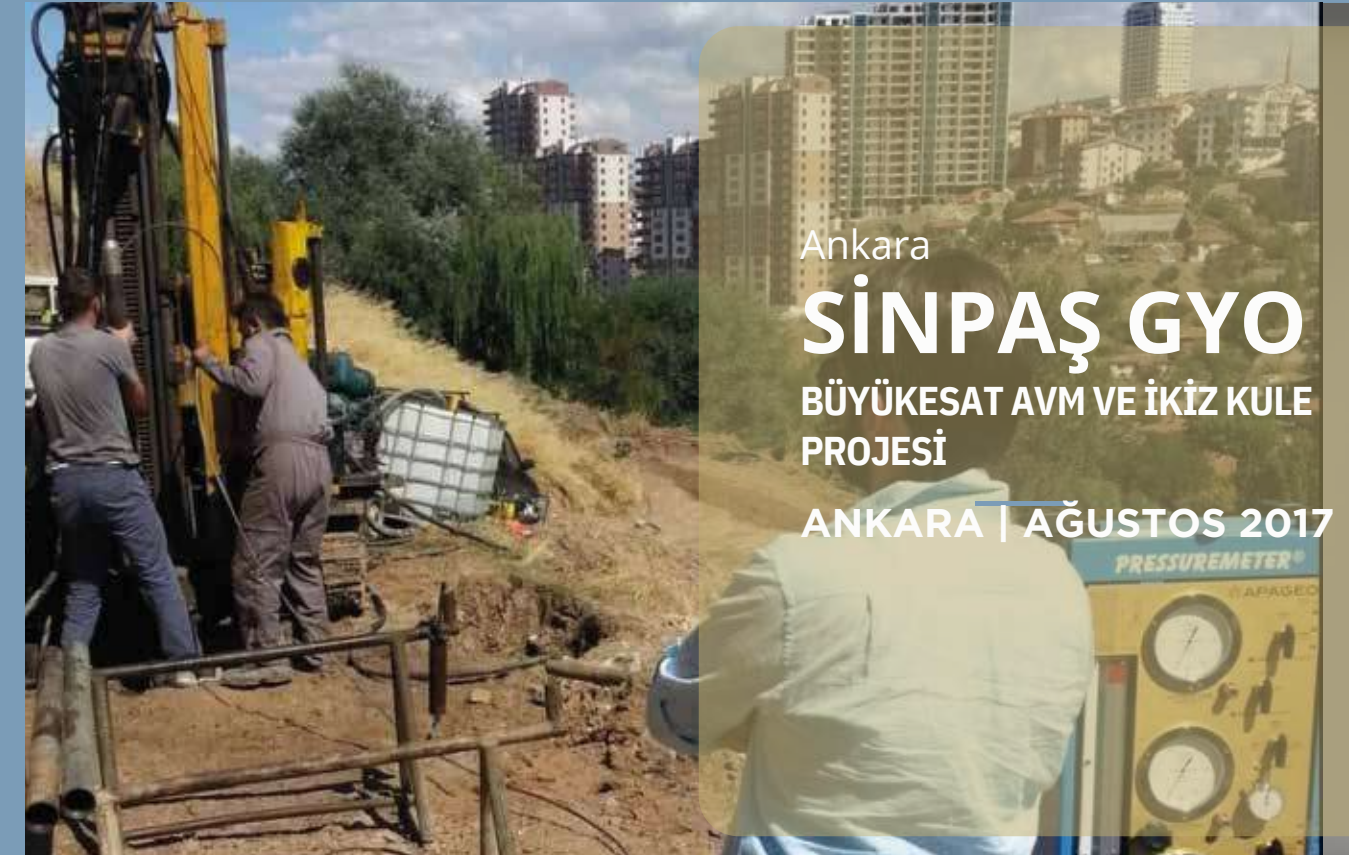
Ankara SİNPAŞ GYO BÜYÜKESAT AVM VE İKİZ KULE PROJESİ ANKARA | AĞUSTOS 2017