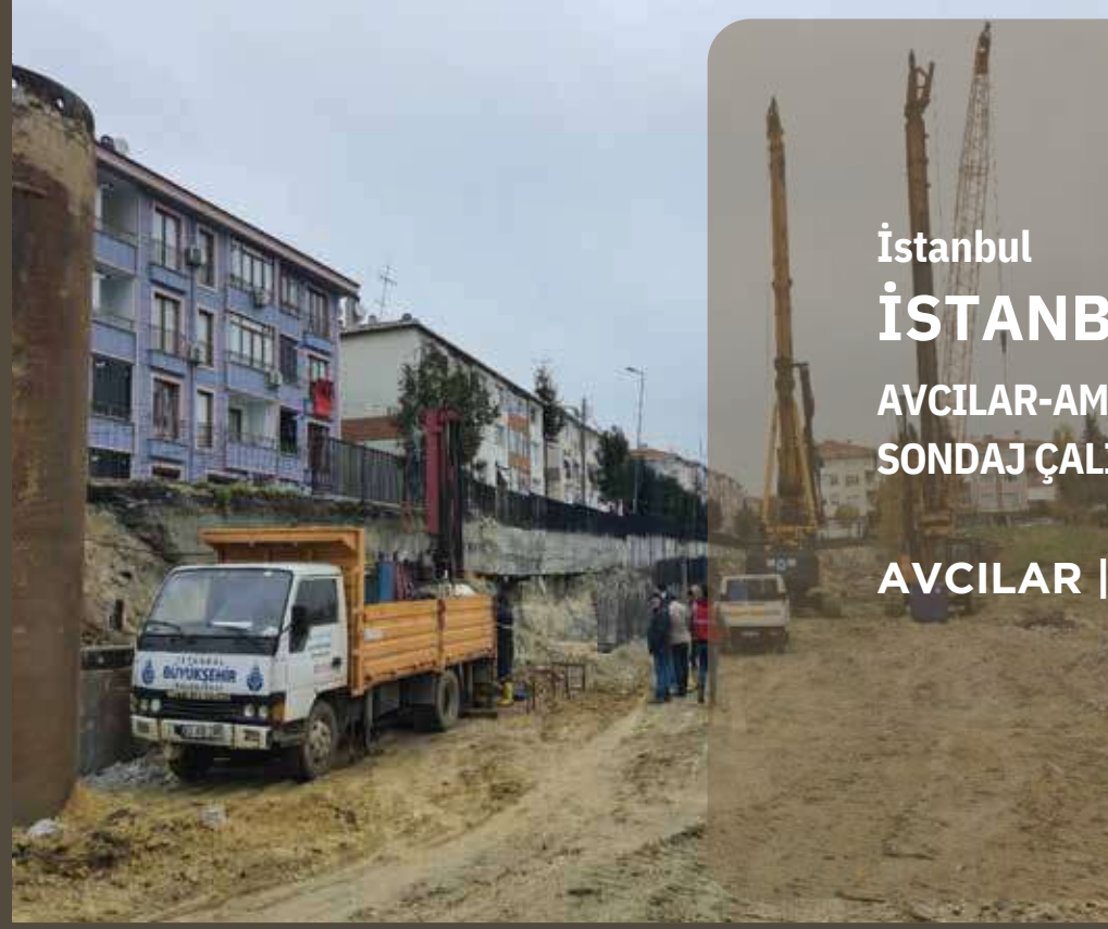
İstanbul İSTANBUL VALİLİĞİ AVCILAR-AMBARLI HEYELAN SONDAJ ÇALIŞMALARI AVCILAR | 2020