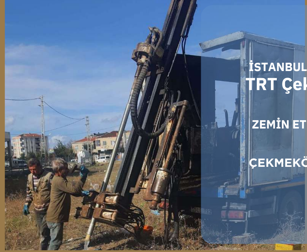
İSTANBUL TRT Çekmeköy ZEMİN ETÜD ÇALIŞMALARI ÇEKMEKÖY/İSTANBUL 2024