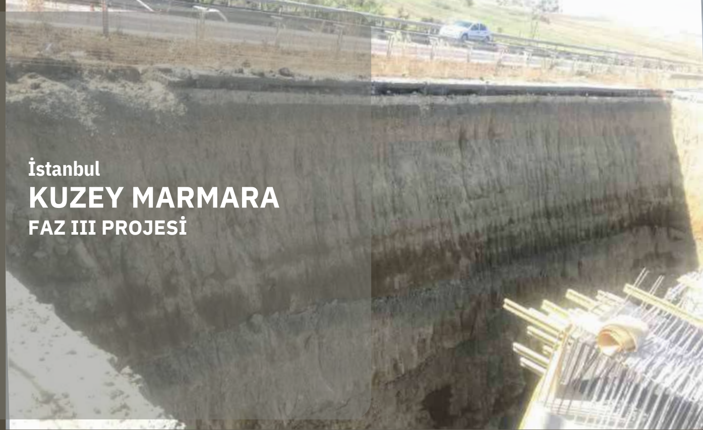
İstanbul KUZEY MARMARA FAZ III PROJESİ