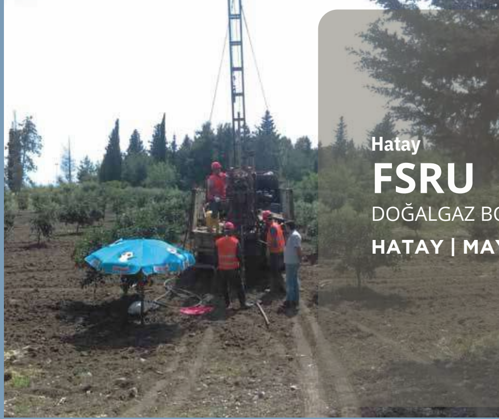
Hatay FSRU DOĞALGAZ BORU HATTI PROJESİ HATAY | MAYIS 2017