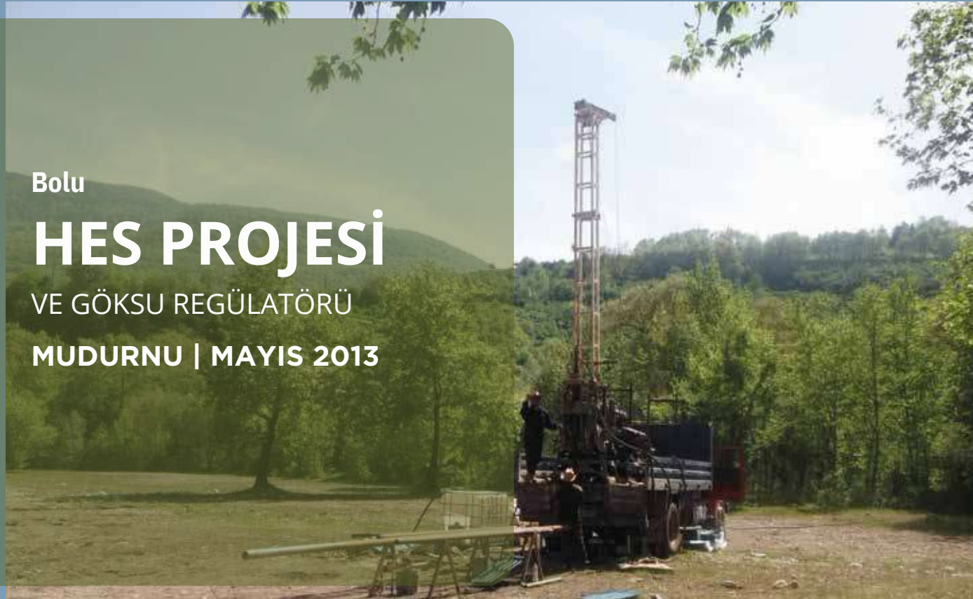
Bolu HES PROJESİ VE GÖKSU REGÜLATÖRÜ MUDURNU | MAYIS 2013