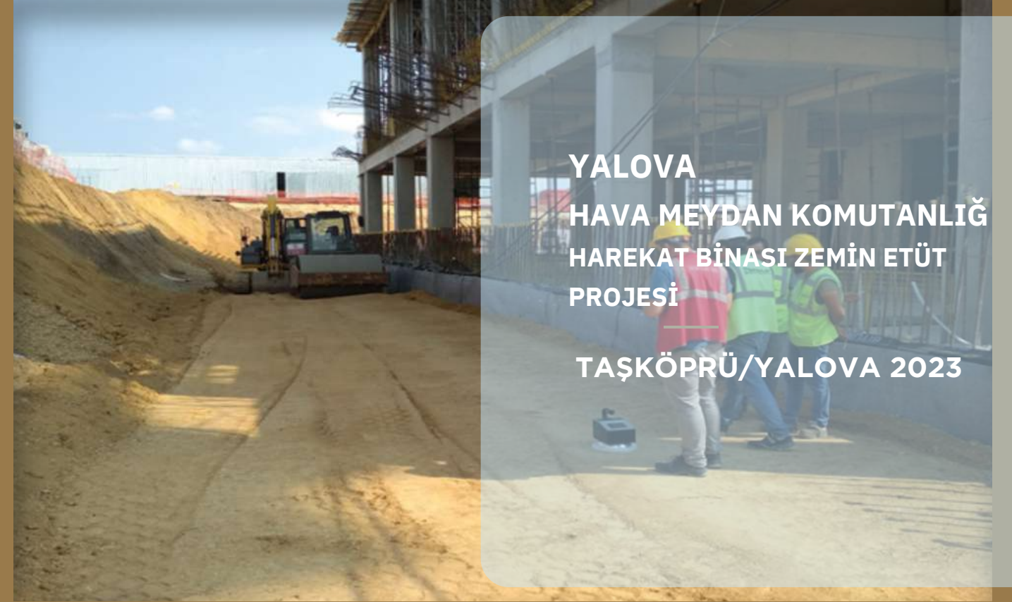
YALOVA HAVA MEYDAN KOMUTANLIĞI HAREKAT BİNASI ZEMİN ETÜT PROJESİ TAŞKÖPRÜ/YALOVA 2023