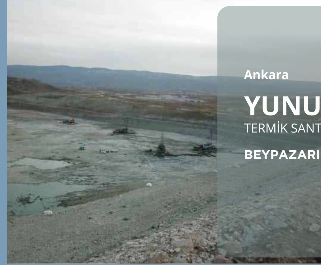
Ankara YUNUS EMRE TERMİK SANTRAL PROJESİ BEYPAZARI | ŞUBAT 2013